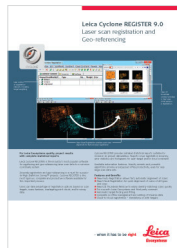
Leica Cyclone REGISTER