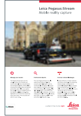
Leica Pegasus:Stream Mobile reality capture