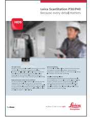
Leica ScanStation P30/P40 Because every detail matters