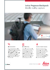
Leica Pegasus:Backpack Mobile reality capture