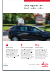
Leica Pegasus:Two Mobile reality capture

Resimler, tanımlar ve teknik veriler bağlayıcı değildir. Tüm hakları saklıdır.